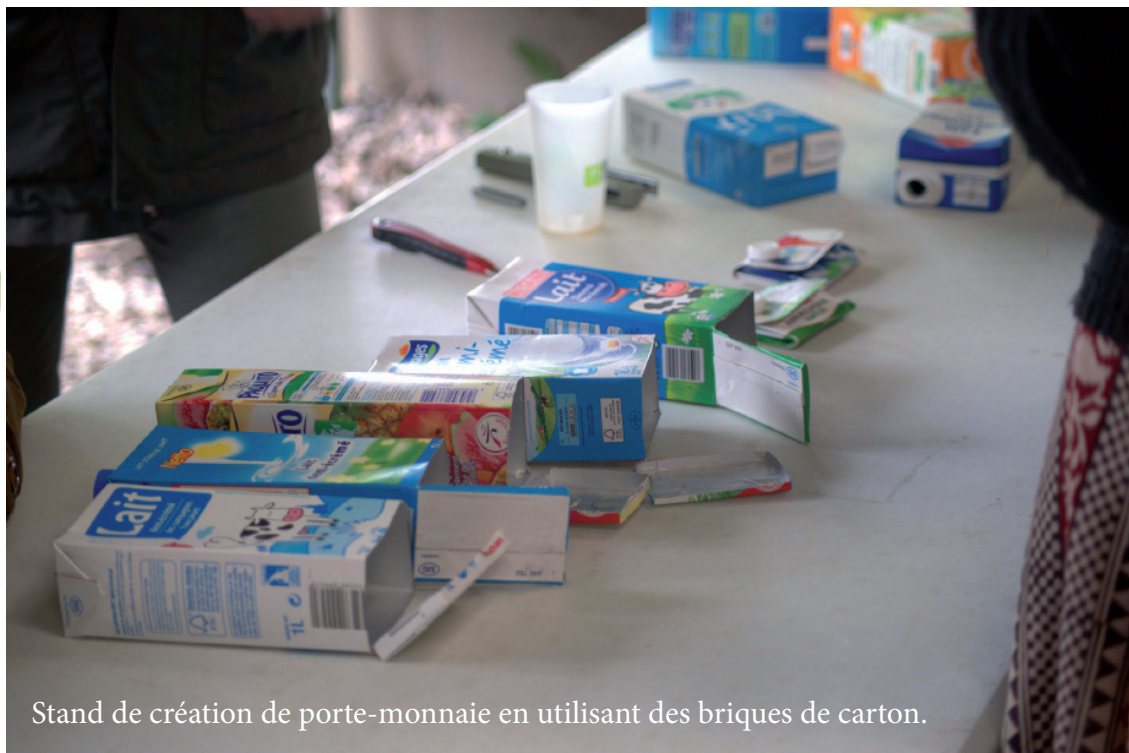
Stand de création de porte-monnaie en utilisant des briques de carton.