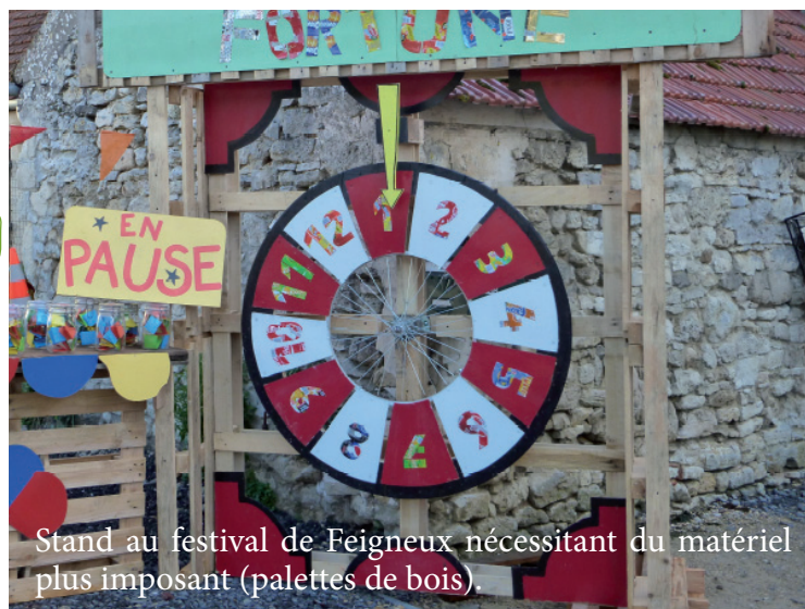
Stand au festival de Feigneux nécessitant du matériel plus imposant (palettes de bois).

Créez vous également un réseau de contacts pour que les déchets ciblés soient gardés pour vous.