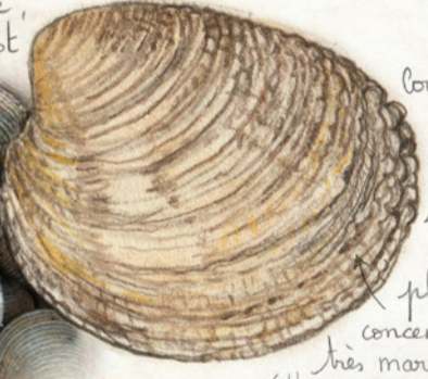
Coquille arrondie, épaisse