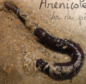
Arénicole 150 mm Ver des pêcheurs, ver des plages sandon, pite