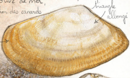
Coquille de petite taille peu bombée, solide