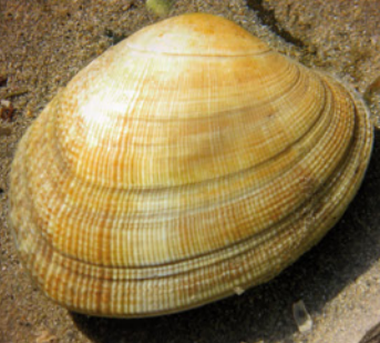
Palourde japonaise 45 mm