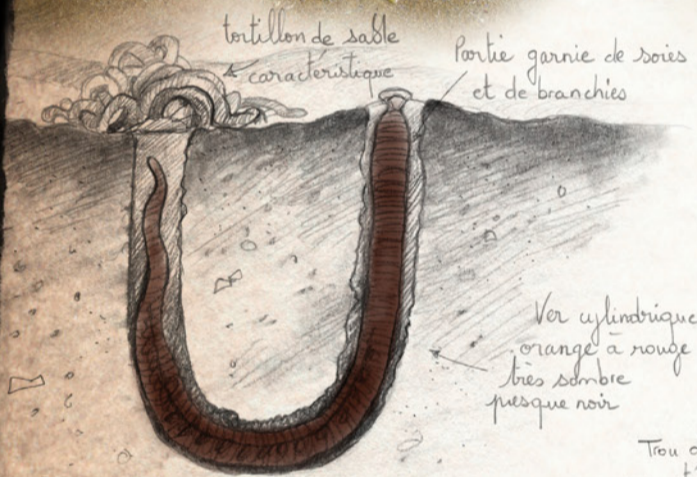
tortillon de sable caractéristique