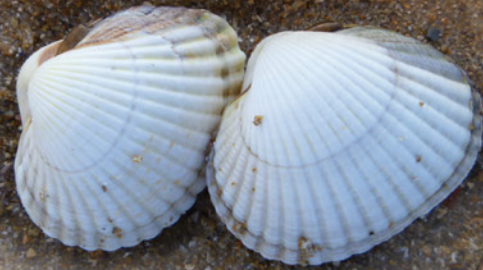
Coque 35 mm héron, rigadot, rigadel, Coque de genêt, coque rayée