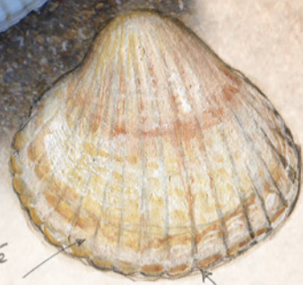
Coquille bombée ovale blanc, jaune ou gris orangé sillons réguliers