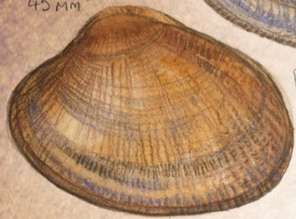
Pour différencier les 2 : Palourde japonaise plus ronde, stries, nuances de colorations plus prononcées