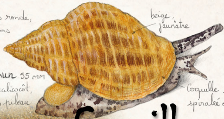
Buccin commun 55 mm Bulot, bavoux, calicot, coucou, ran, pileau