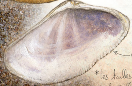
bord interne crénelé