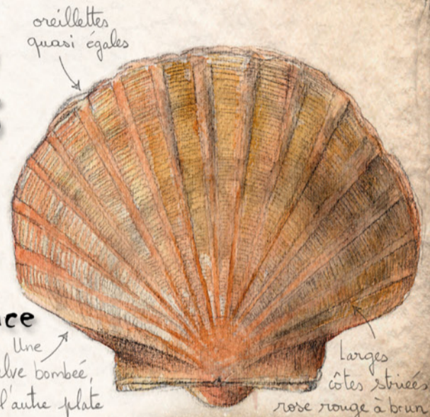
oreillettes quasi égales