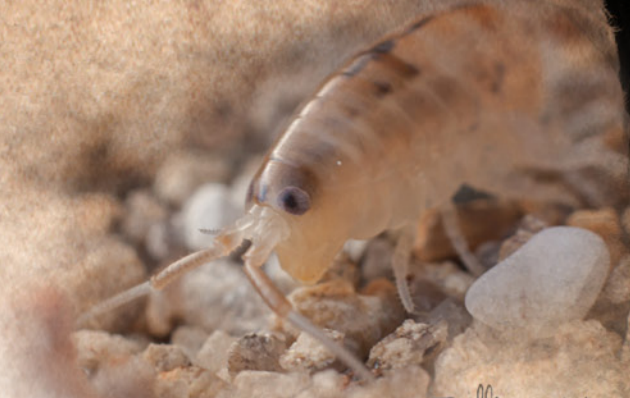
Couleur variable souvent jaune sable avec ou sans taches brunes