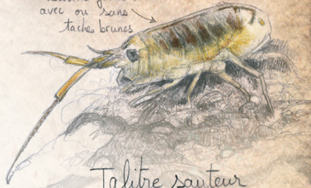
Talitre sauteur Puce de mer, écrelle, sautiot de sable